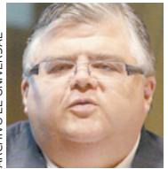
Agustín Carstens , de Banxico

El gobernador del Banco de México, Agustín Carstens , será copresidente de "Los Principios" del Instituto Internacional de Finanzas (IIF), una organización mundial que engloba a instituciones financieras de primer nivel en el terreno privado y público. El objetivo de esta institución es sostener principios de cooperación internacional para la prevención y negociación de crisis de deuda soberana. Carstens hará mancuerna con el copresidente Zhou Xiaochuan , gobernador del Banco Central de la República Popular de China. Por lo pronto, el actual copresidente del consejo, el gallo Jean Claude Trichet , resaltó la labor del mexicano por su "manejo ejemplar de la economía en los últimos años".