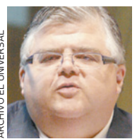
Agustín Carstens , de Banxico

El gobernador del Banco de México, Agustín Carstens , será copresidente de "Los Principios" del Instituto Internacional de Finanzas (IIF), una organización mundial que engloba a instituciones financieras de primer nivel en el terreno privado y público. El objetivo de esta institución es sostener principios de cooperación internacional para la prevención y negociación de crisis de deuda soberana. Carstens hará mancuerna con el copresidente Zhou Xiaochuan , gobernador del Banco Central de la República Popular de China. Por lo pronto, el actual copresidente del consejo, el gallo Jean Claude Trichet , resaltó la labor del mexicano por su "manejo ejemplar de la economía en los últimos años".